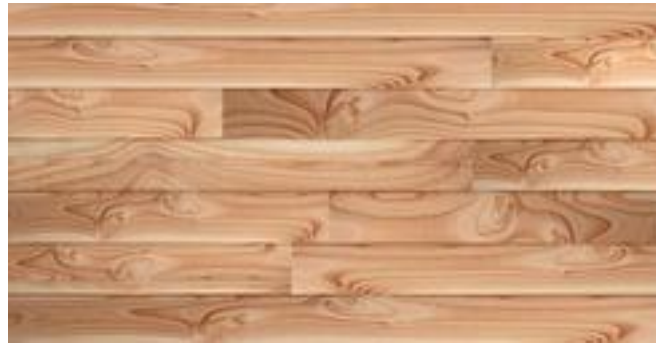
Bardage clin douglas