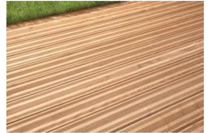
Lame de bois douglas (terrasse)