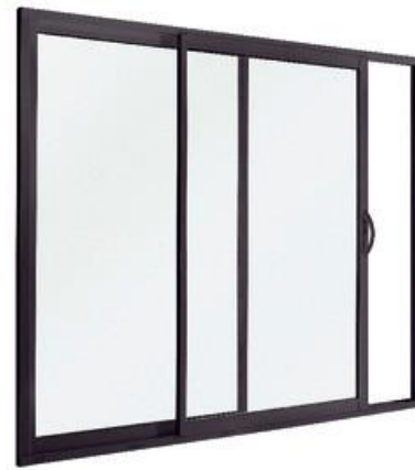
Portes et fenêtres aluminium gris-anthracite