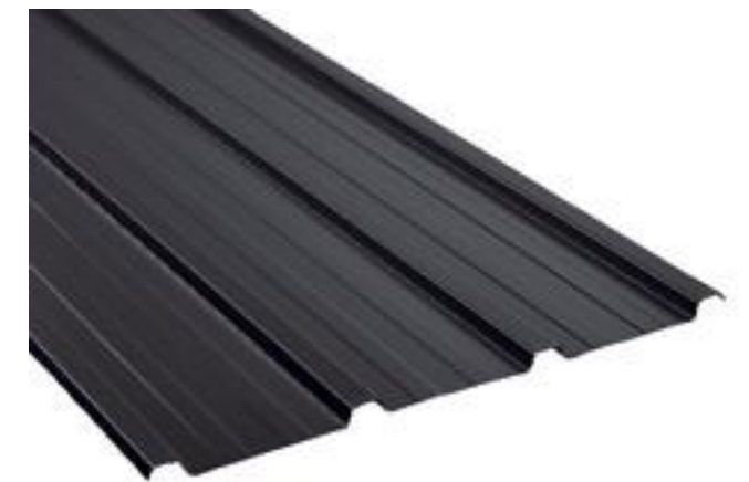
Bac d'acier couleur graphite